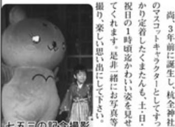
七五三の記念撮影

11月と言えば七五三の季節。杭全神社も七五三を祝うご家族連れで賑わいます。初穂料五千円(お土産、お守り、千歳飴付き)尚、3年前に誕生し、杭全神社のマスコットキャラクターとしてすっかり定着したくまたんも、土・日・祝日の1時頃迄かわいい姿を見せてくれます。是非一緒に写真撮影、楽しい思い出にして下さい。