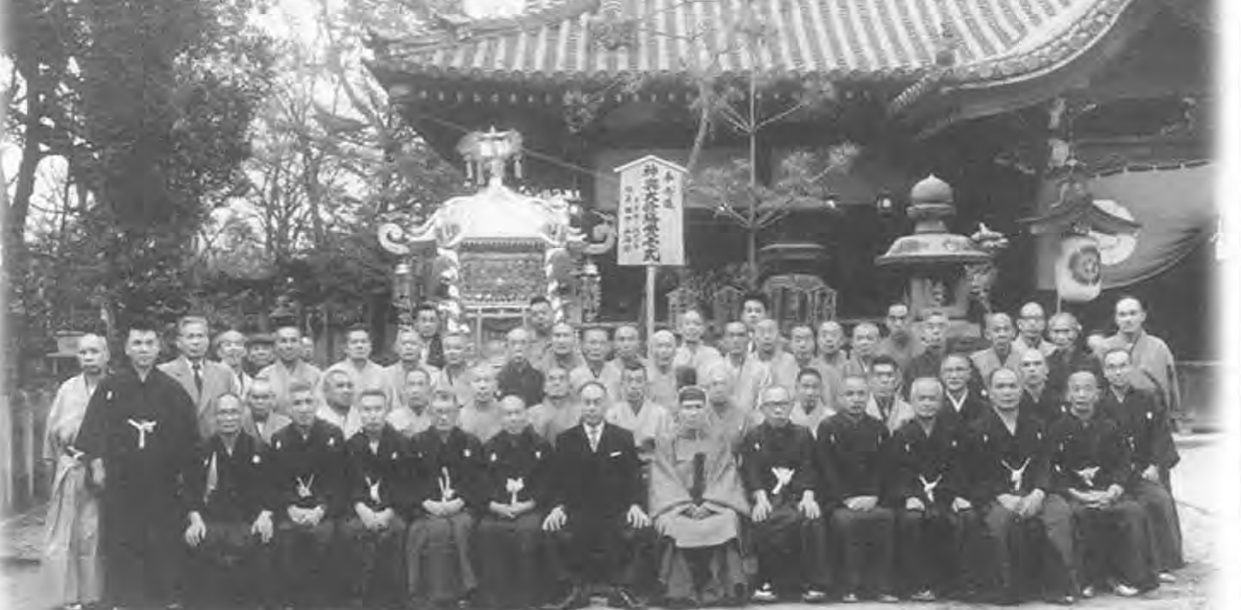
昭和36年4月、杭全神社にて神輿大修繕記念撮影。懐かしい顔が見つかるのでは...?

◆「ひらの寄席」ほんとに格安です。普通なら千五百円〜二千円はすると思います。5人の嘶し家、落語家によるたぶが2時間楽しいですよ。(HOさん・長吉六反3丁目・64才・男性) ◆今年ももうすぐ「だんじり」の季節ですね。今年の子どもと嫁と見に行く予定です。これからは地域密着型の情報紙として楽しみにしています!!(KKさん・菅戸口1丁目・30才・男性)