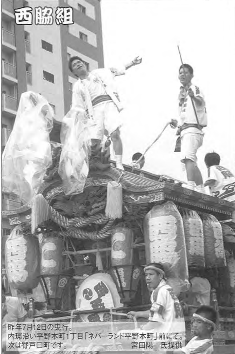
昨年7月12日の曳行。内環沿い平野本町1丁目「ネバーランド平野本町」前にて。次は脊戸口町です。