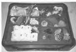
お薦めの幕の内弁当