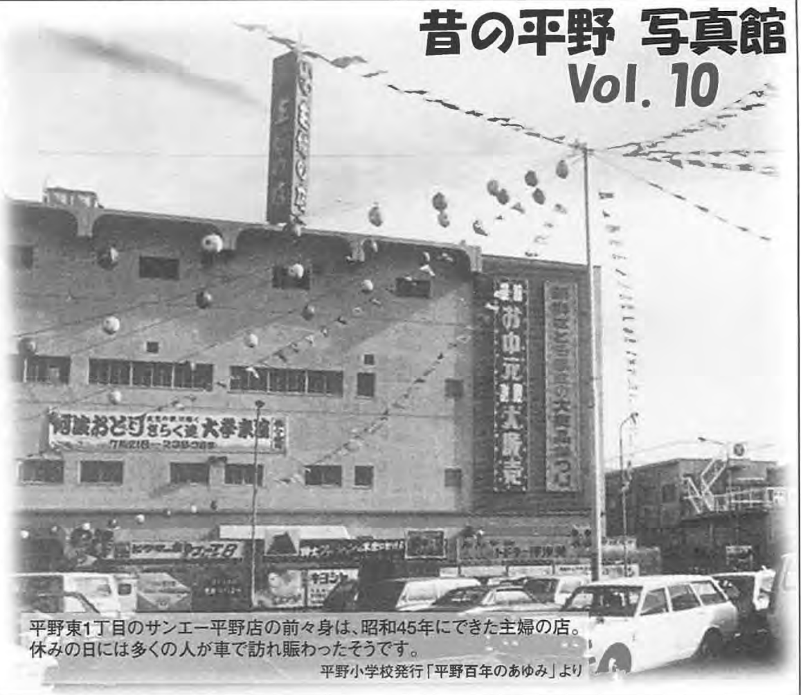
平野東1丁目のサンエー平野店の前々身は、昭和45年にできた主婦の店。休みの日には多くの人が車で訪れ賑わったそうです。 平野小学校発行「平野百年のあゆみ」より